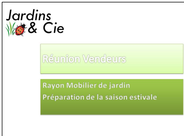
Diapositive de titre